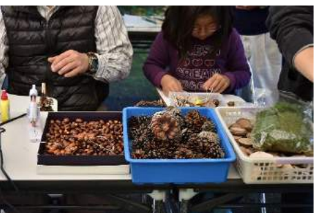
どんぐりクラフト