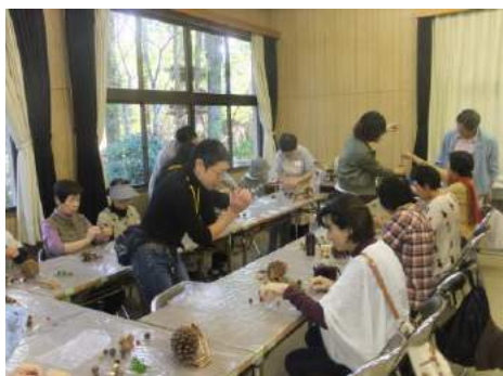
トロッケンゲビンデ作り