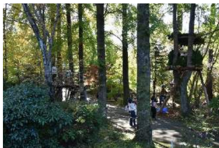
スカイロープとツリーハウス