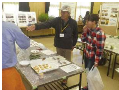
どんぶりクッキー