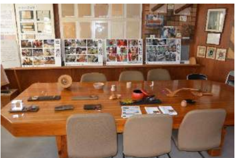
高等技術専門校の方の作品展示