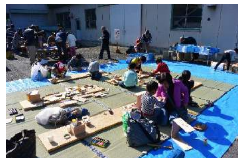
ネイチャークラフト