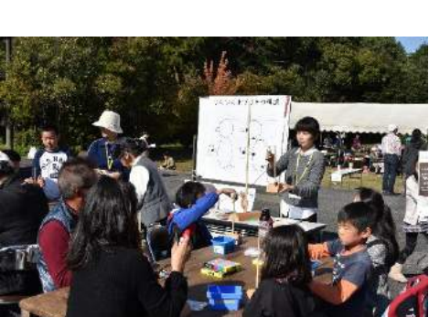
つくつくキツキ作り